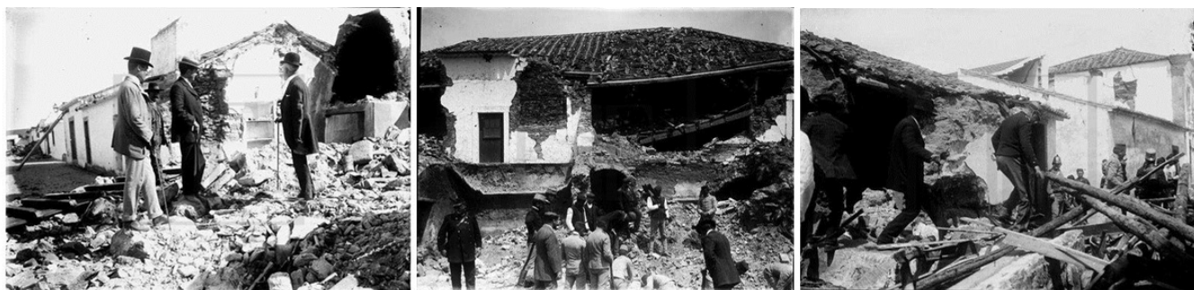
Figura 1. Fotografias intituladas “Em busca de um cadáver – Benavente: trabalhos nos escombros, com a assistência do Governador Civil de Santarém e oficiais da força militar de caçadores 6”. Imagens integradas na reportagem “Através dos escombros do Ribatejo: o terramoto de 23 de Abril” (ANTT, Empresa Pública do Jornal O Século , Joshua Benoliel, cx. 262, negativo 11.).